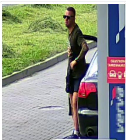
Zatankował i nie zapłacił