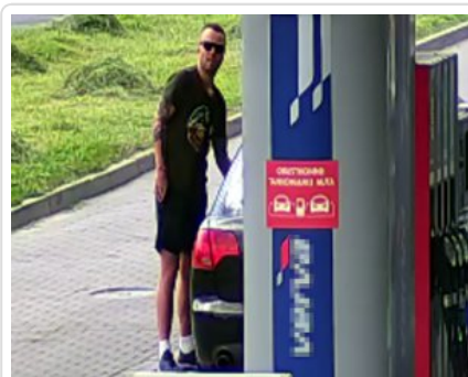
Zatankował i nie zapłacił